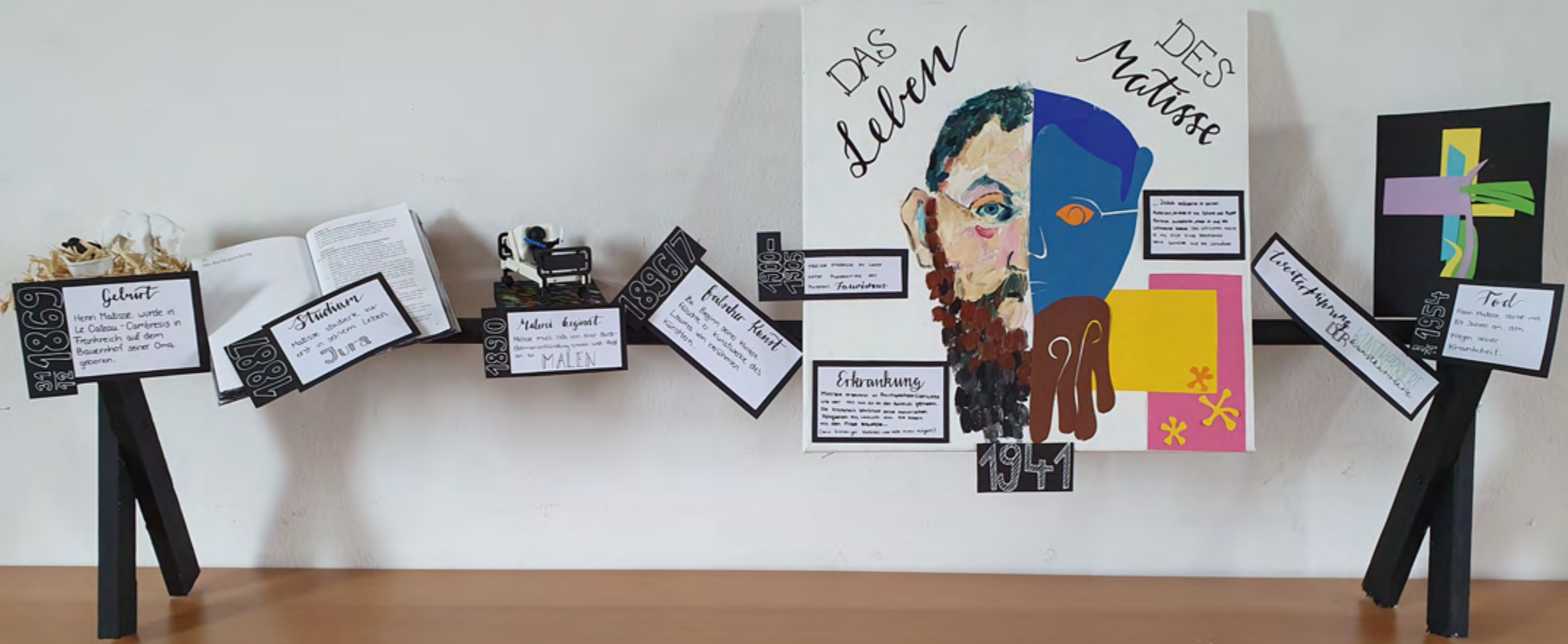
Das Leben des Matisse erforscht von LOUISA FRICKE & MARA HOFFMANN